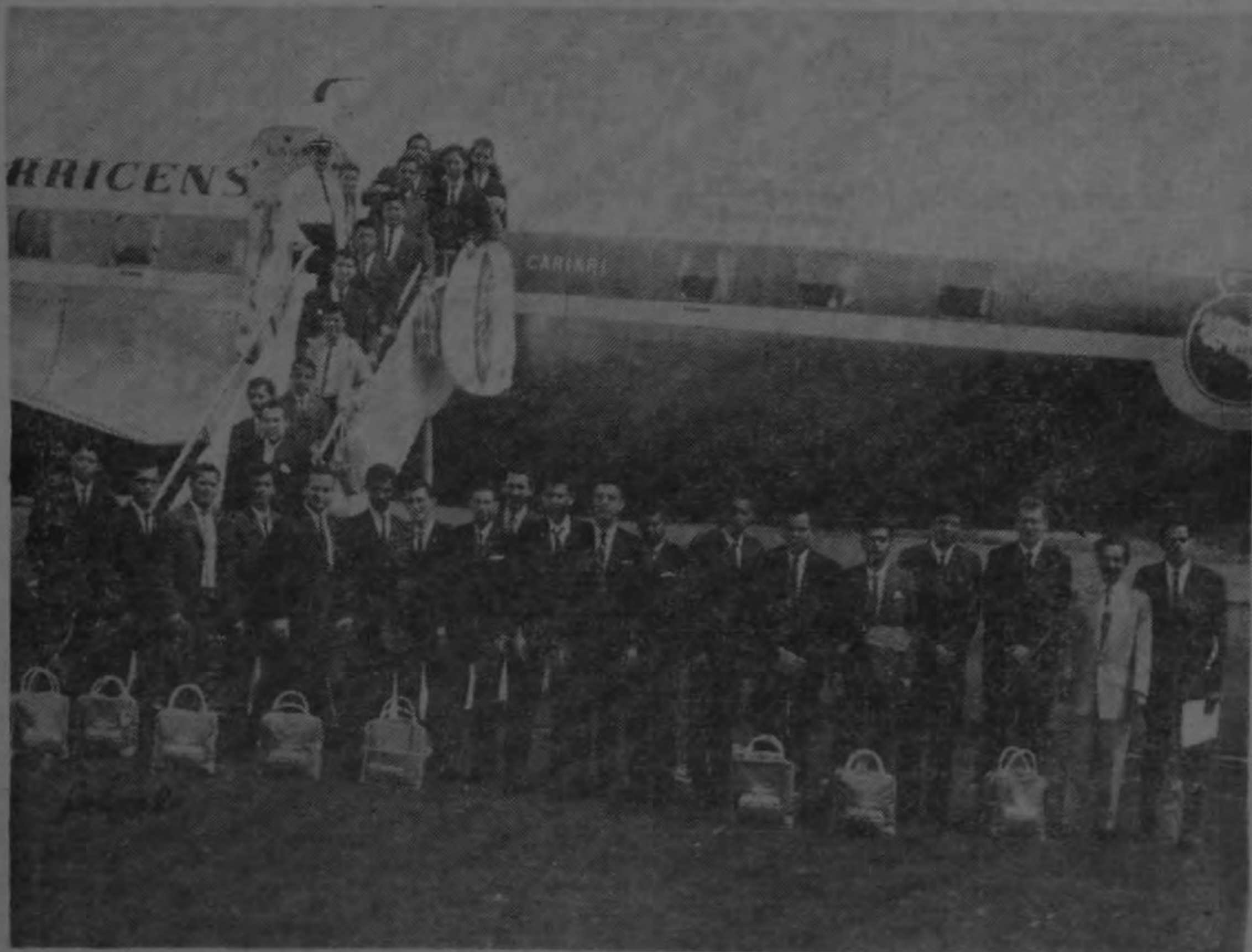
En la gráfica se aprecia el grupo de estudiantes costarricenses en el momento de emprender su viaje rumbo a España.