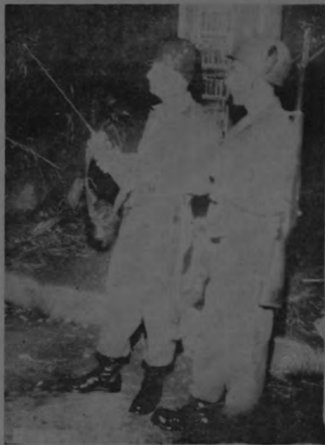
Guardias Civiles fueron colocados al frente del panel telefónico que anoche trató de ser dinamitado por terroristas, en su cuarta explosión en menos de siete días. Las autoridades se hicieron presentes en el lugar de los hechos, portando numeroso equipo militar.

"...Cuando retornábamos a nuestra ruta, encontrándonos al frente de la Importadora Fotográfica, escuchamos la explosión. Estos datos se los hemos suministrado a las autoridades, junto con otros".