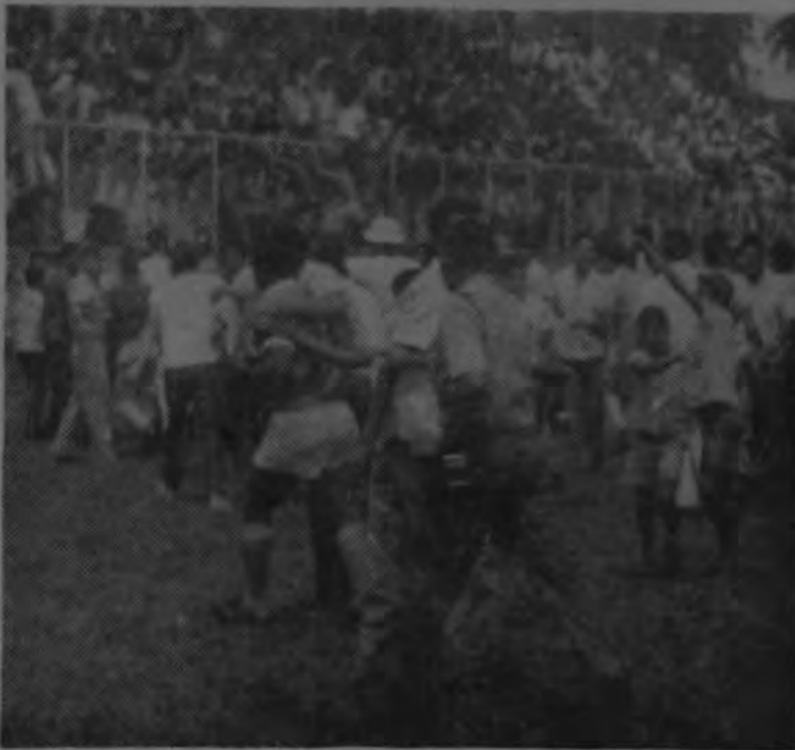
El público porteño inundó el enzacatado para felicitar a los jugadores que el domingo le arrebataron el invicto al Deportivo Saprissa.

SIXAOLA 3 3 0 JUNIORS 2 2 0 VOLKSWAGEN 3 2 1 PEPSICOLA 2 1 1 PRENSA LIBRE 3 1 2 VOCACIONAL 2 0 2