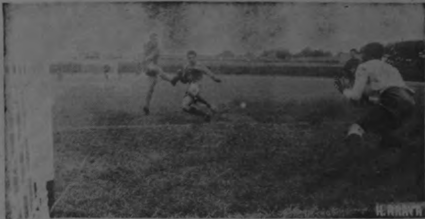
Este fue uno de los tres magníficos goles marcados el domingo por el brioso ariete Juan Ulloa en la valla orionista. Fue el factor determinante para el triunfo de su oncena y además elevó

su porcentaje de goleo personal hasta colocarse ahora en el primer lugar con un total de 19 goles demostrando su efectividad.