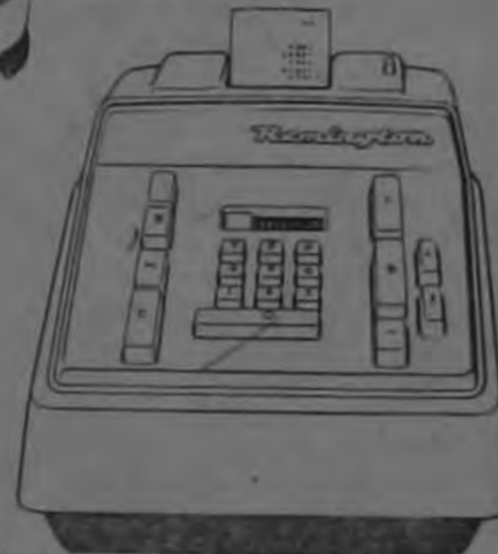
Manual, compacta, saldo negativo, capacidad 10/11, eficiente y a muy bajo precio.

Sumadora eléctrica, capacidad 10/11, gran velocidad, saldo negativo, división por sustracción, acumula y tiene factor constante.