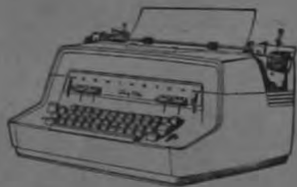
Modelo 24, manual, regulador de tacto, base para borrar. Suavidad especial en el teclado.

Completamente eléctrica, claridad y precisión, cinco teclas automáticas.