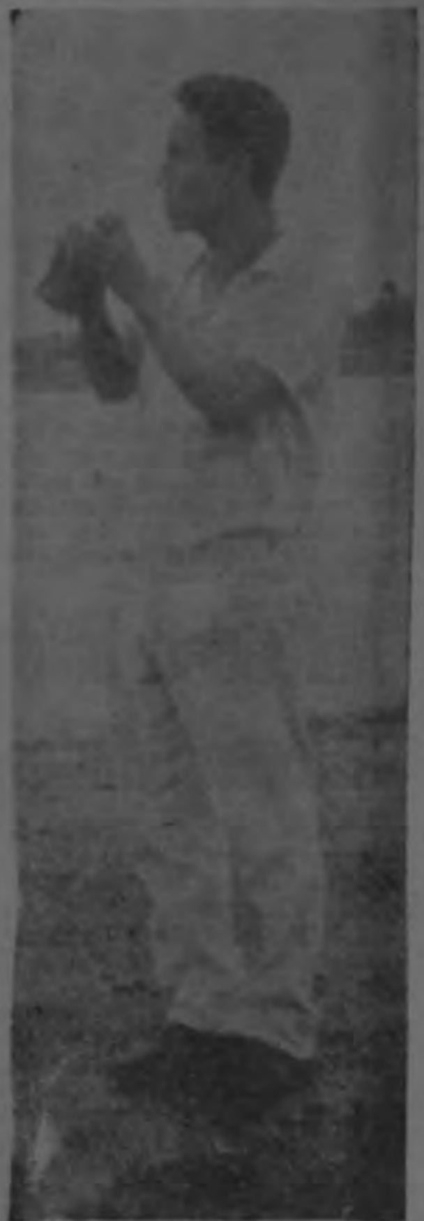
Este es el único indio cuyo nombre no se conoce, que ayudaba a las autoridades de Seguridad Pública en la búsqueda del avión argentino desaparecido en noviembre del año pasado con 69 personas a bordo, la mayoría de ellos cadetes. Fue hallado muerto el domingo pasado en circunstancias misteriosas que las autoridades tratan de establecer. La búsqueda en helicóptero que se inició ayer tenía como base de operaciones el patio de su rancho. La foto de Araya fue tomada en el campo de aterrizaje en Limón hace algunos días. El indio sostiene en sus manos unos binóculos.

matrícula T-C 48, perdido desde el 3 de noviembre de 1965.